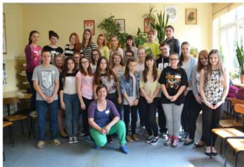
Uczniowie pracujący w projekcie

Materiały wypracowane w ramach projektu „Szkoła Dialogu” - projektu edukacyjnego Fundacji Form